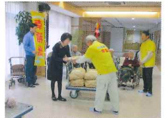
下吉田区で作られた、「幸福米」を 寄贈して頂きました。