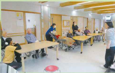
ユニット内でレクリエーション しりとりとジエスチャーゲーム をしました