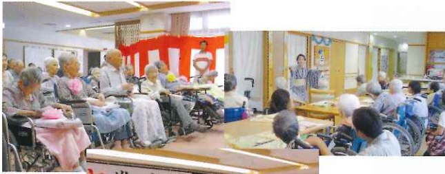
三宅小学校4年生 施設見学・音楽発表