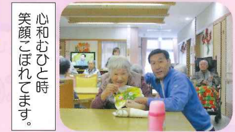
心とむひと時 笑顔こぼれてます。