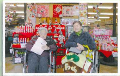
高浜ひな祭りにて