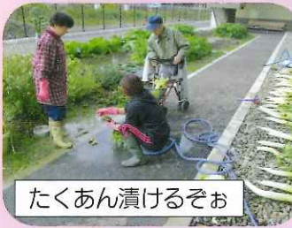
たくあん漬けるぞお