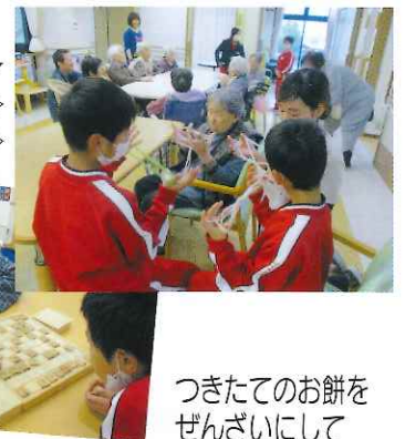
つくたてのお餅を ぜんざいにして みんなで食べました♪ みなさん、お餅を 丸める作業は、 やはり慣れた手つきで、 流石でした!!