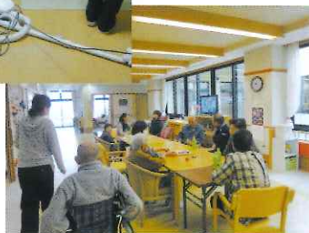
野木小学校の生徒さんから 「野木つ子農園」で作った お米を頂きました☆