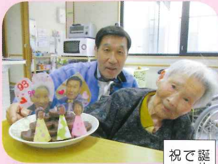
誕生日には でっぴょうかんで 祝ってもらたんや。