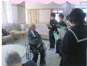
上中中学生施設見学