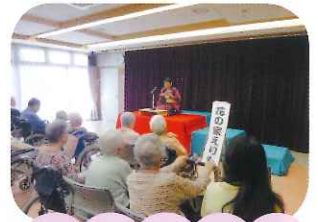
関西大学生による 落語を聞きました☆