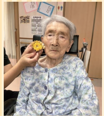
苑の畑で採れた サツマイモで おやつを作りました