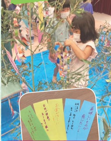
願い事が届きますように…