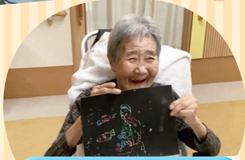
満足な出来上がり