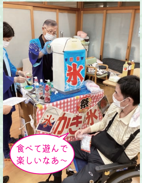
食べて遊んで 楽しいなあ～