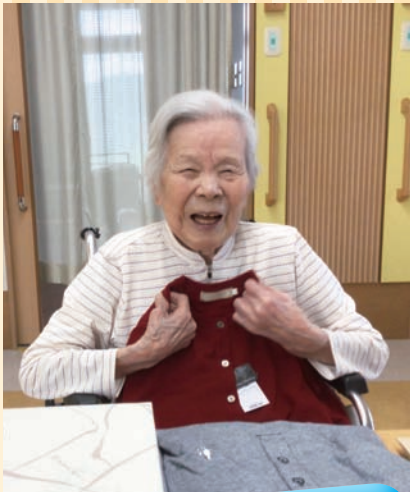
プレゼントをもらってニコニコ