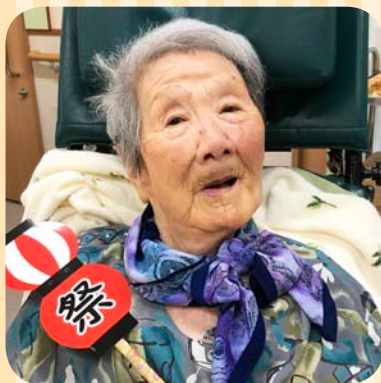
今日は起きて お祭りに参加しました