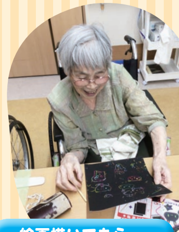
絵画描いてもらっ ちゃった、ニコニコ