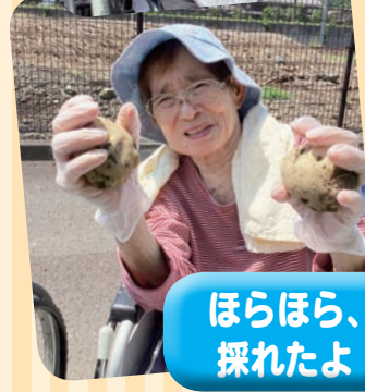
ほらほら、採れたよ