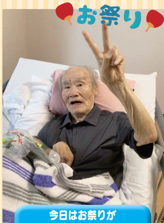
今日はお祭りが お部屋に来ました