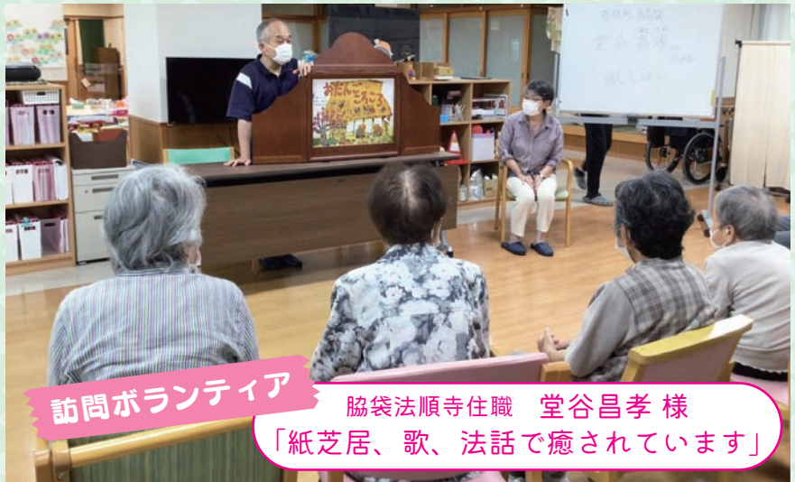
訪問ボランティア