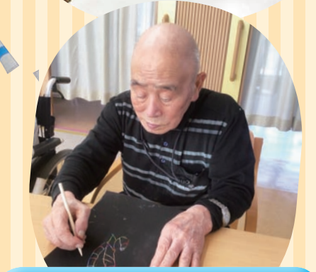
もくもくと絵画中