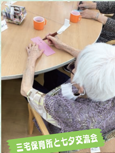
三宅保育所と七夕交流会