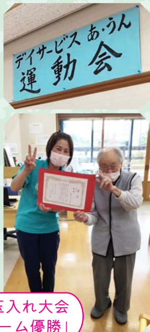
曜日対抗玉入れ大会 「火曜日チーム優勝」